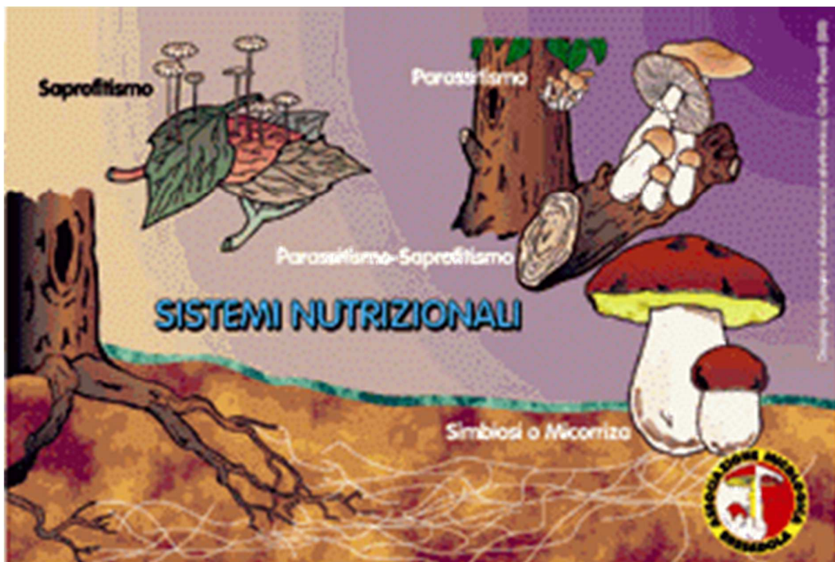
Schema riassuntivo dei sistemi nutrizionali dei funghi (elaborazione grafica C. Papetti)

Sono funghi simbionti i Boletus , compresi quelli del Gruppo dell' Edulis , le Amanita , i Cantharellus , i Cortinari , gli Hygrophorus , i Tricholoma , le Russula , i Lactarius , etc.